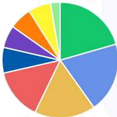
DFDs POR ÁREA DEMANDANTE